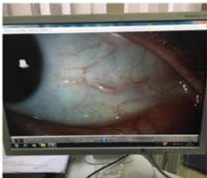
Рис. 6. Дирофилярия в глазу человека (2019 г.)

Особый интерес представляет дирофиляриоз на территории области. В Калужской области зарегистрировано 3 случая дирофиляриоза у человека (в 2015, 2017, 2019 гг.) и 18 случаев дирофиляриоза у животных.